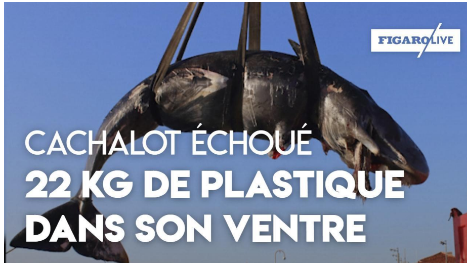
Cachalot retrouvé en Sardaigne