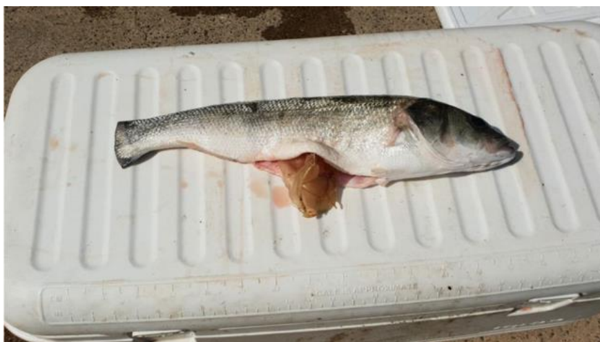
Poisson ayant avalé un gobelet plastique (Corse)

Microplastiques trouvés par le bateau « Tara » en Méditerranée : absorbés par toute la chaîne alimentaire marine ... jusque dans nos assiettes !